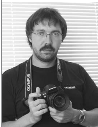
ТЕКСТ И ФОТО: Илья Варивченко

Ф отografiей я занимаюсь уже больше 20 лет, но цифровое фото я открыл для себя именно с техники Olympus. Первой цифровой «зеркалкой» стала E-300. Выбор был сделан по ряду причин: фирменная «олимпусовская» цветопередача, отличная эргономика и доступная цена.